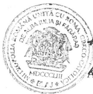
* Lucian Cardinal Mureșan Arhiepiscop Major și Mitropolit